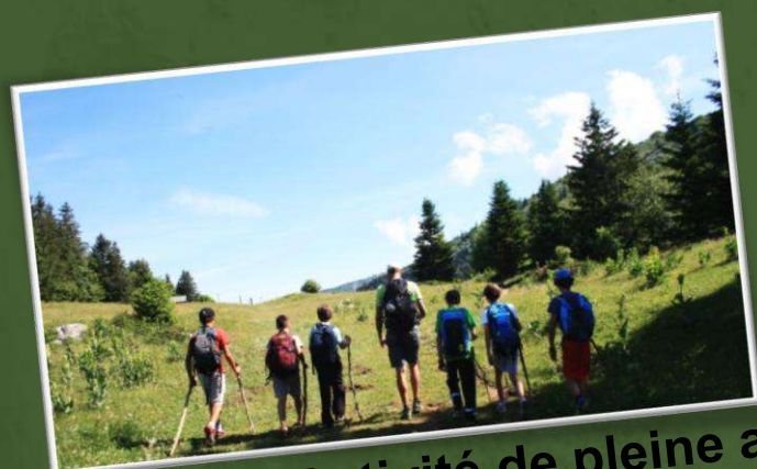
Activité de pleine air

SUR DEVIS en fonction du nombre de jours et du déroulé du séjour. Le pique-nique du 1 er jour n'est pas inclus