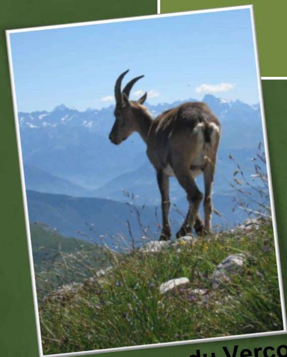
Faune du Vercors

Ce tour permet de traverser villages, forêts, alpages, cols et plateaux. Un parcours parsemé d'histoires et de paysages aussi extraordinaires que variés !